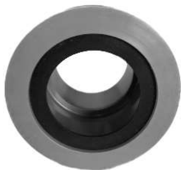
MANCHON JOINT À LÈVRE DROIT F/F 50/50 Réf. AMANDRO