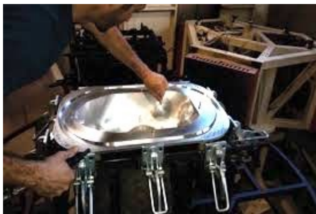
Moule de fabrication

Nous vous proposons une nouvelle génération d'urinoir, développé et fabriqué entièrement en France à l'aide d'un moule de rotomoulage dans lequel on injecte du polyéthylène. Il est 100 % recyclable.