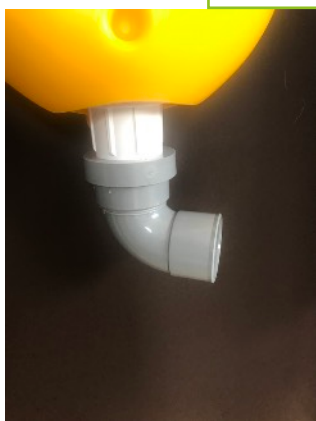
Manchon joint à lèvres coudé 87°30, 50 mm

S'emmanche facilement. Permet également des manipulations plus aisées pour les professionnels de la location.