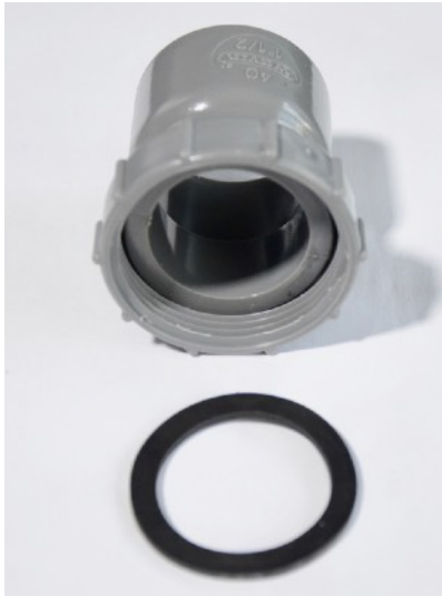
Douille femelle à écrou